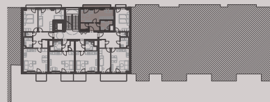
situace bytové jednotky celkový půdorys