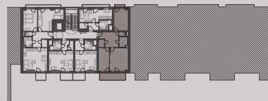
situace bytové jednotky celkový půdorys