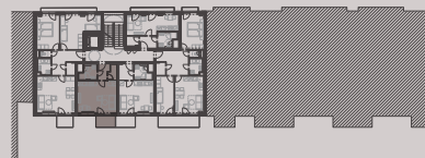
situace bytové jednotky celkový půdorys